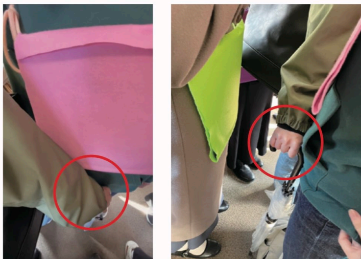
【図1】 左：B警察官目線 右：少年の隣の乗客からの目線