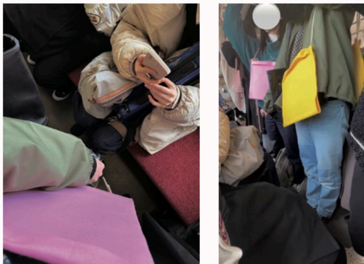
【図3】 左：少年からの目線 右：ロングシートに座っている乗客からの目線