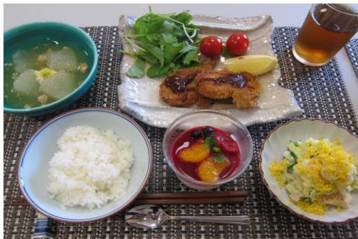
—ヒレ肉カツ・冬瓜えびあん・ミモザサラダ ヨーグルトムースフルーツかけ—

参加者の皆様からの声 「適度に子どもと離れて準備や調理ができた為、親が口や手を出さず良い体験をさせていただけることができました。子どもの夏休みの思い出づくりになりました。また参加したいです！」 参加者の子どもさんからの声 「たのしかったです。またきておいしいものをつくりたいです。わたしもおかあさんになつたら子どもにおしえてあげたいです。」