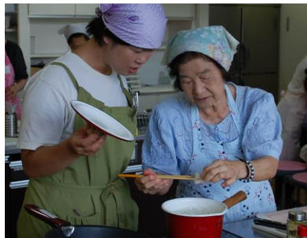
—固さはこれくらいね！—