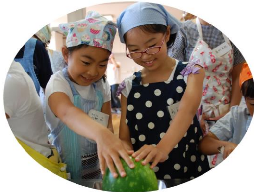
—冬瓜（とうがん）ってでっかい！—

参加者の皆様からの声 「適度に子どもと離れて準備や調理ができた為、親が口や手を出さず良い体験をさせていただけることができました。子どもの夏休みの思い出づくりになりました。また参加したいです！」 参加者の子どもさんからの声 「たのしかったです。またきておいしいものをつくりたいです。わたしもおかあさんになつたら子どもにおしえてあげたいです。」